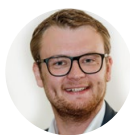
Martin Pister Thüga SmartService GmbH