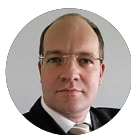
Jens Lück Bundesnetzagentur für Elektrizität, Gas, Telekommunikation, Post und Eisenbahnen